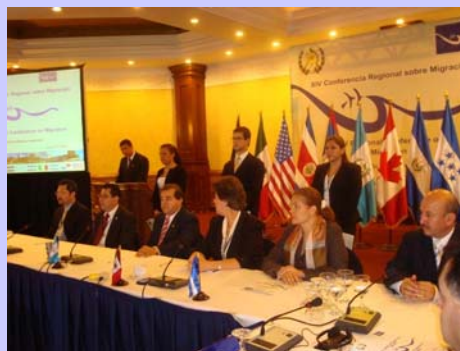
El lanzamiento oficial de la campaña “No más trata de personas” se realizó en Guatemala en el marco de la XIV Conferencia Regional sobre Migración con la participación de Ministros de Seguridad, Gobernación y Relaciones Exteriores de la región.