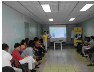
Taller del Programa Amor realizado en marzo del año en curso.

Debemos continuar fortaleciendo las Coaliciones de cada país y que se mantengan en constante coordinación, para realizar un trabajo en todos los componentes y ahondar en el tema de la Procuración de la Justicia. A la vez, formular proyectos regionales donde se involucre a los países de Centroamérica y trabajar de forma coordinada en todos los componentes. Asimismo continuar divulgando en la región lo que cada país hace en materia de trata de personas y realizar intercambios de experiencias binacionales, trinacionales y regionales con las instancias involucradas.